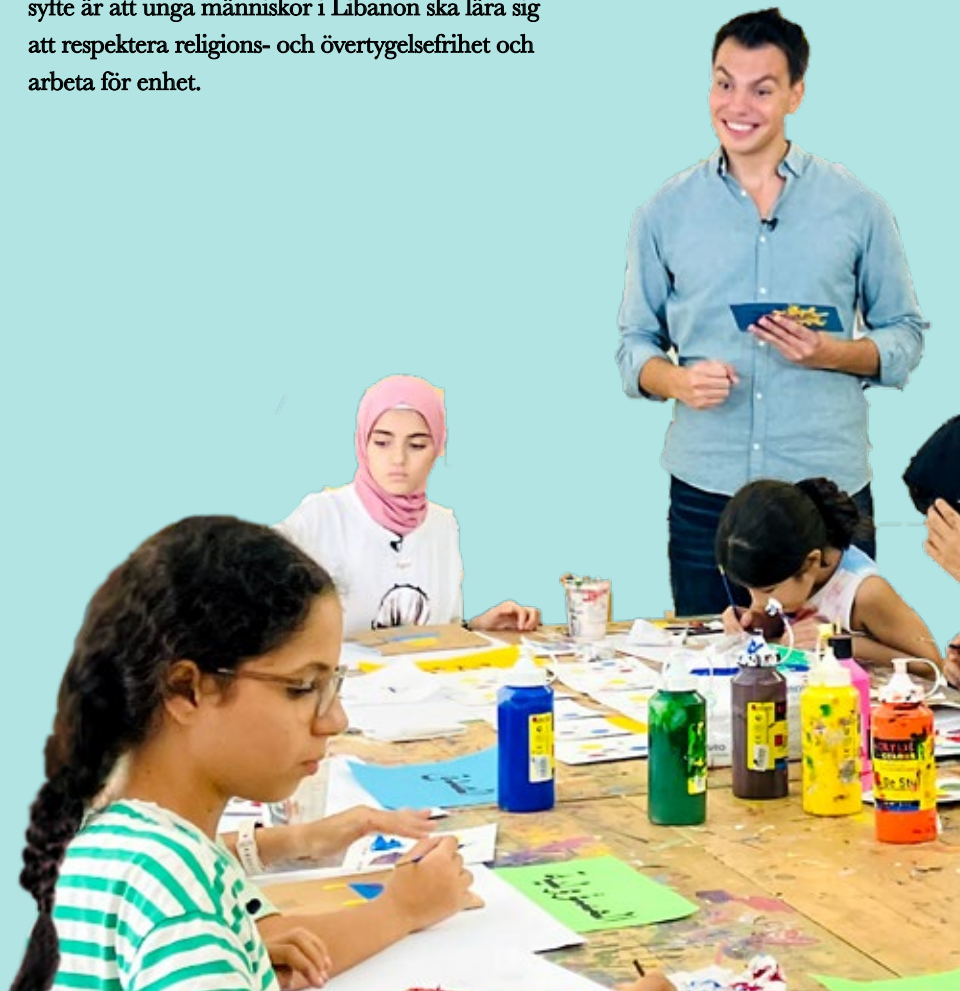
Nedan: Att rita bilder om fred var en del av Pussel -projektet.