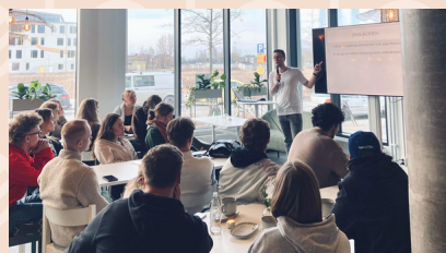
Föreläsning i caféet