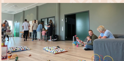
Öppna förskolan i "Utsikten"

Församlingens barnverksamhet på tisdagskvällar, IMK One Piece, firade ett hejdundrande 10-årsjubileum under våren. Vi tacka Gud för 10 härliga och viktiga år med denna verksamhet. Till hösten blir det något annat. Var med i bön för hur vi ska forma vår barnverksamhet framåt!