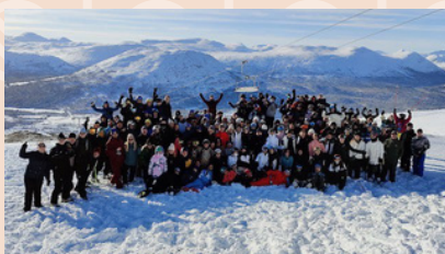
Deltagarna i backen i Bjorli