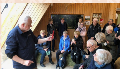
Bussresa till Vadstena

Under våren har ungavuxnaarbetet hittat in i våra nya lokaler och vi gläds över att flera nya unga vuxna har hittat hit. Tillsammans har vi anordnat föreläsningar, panelsamtal och startat upp spelkvällar med quiz och brädspel. Vi har även fortsatt med våra lovsångskvällar SÖK och luncher efter gudstjänsten en gång i månaden.