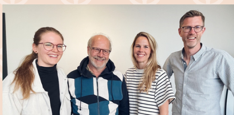
Vårt nya barnråd