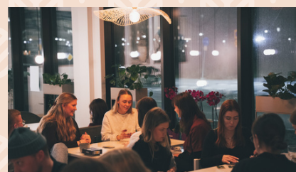
Spelkväll för unga vuxna