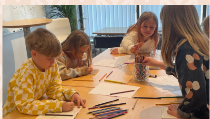
Pyssel på påsklovsdagen