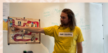
Ledare på IMK Söndag

Under våren bjöd vi in till Afternoon tea vid tre tillfällen. Många människor och mycket musik vid dessa uppskattade mötesplatser. En annan härlig mötesplats under våren var bussresan till Vadstena och Tåkern.